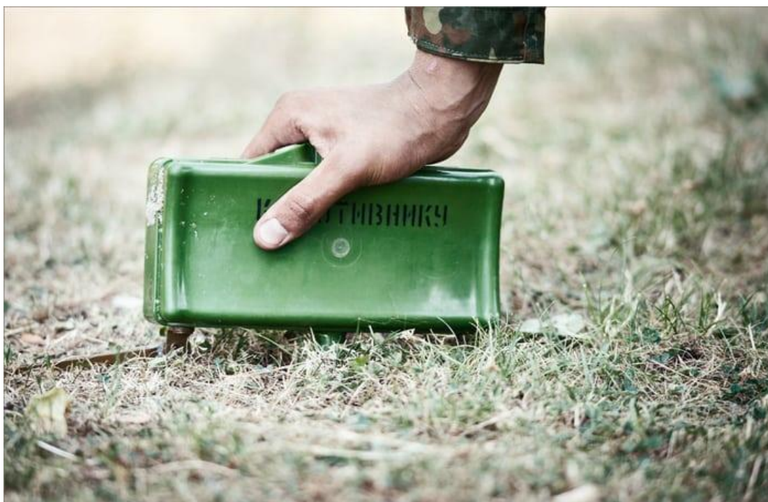
Мина в боевом положении