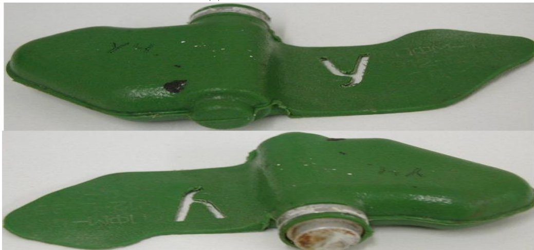
Внешний вид « Мины – ЛЕПЕСТКА »:

Масса мины 80 грамм, размеры – 12 х 6 сантиметров, чувствительность мины лежит в пределах 5-25 кг, что вполне достаточно для срабатывания от веса маленького ребенка.